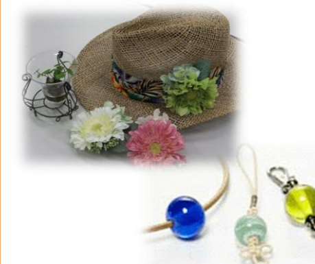
とんぼ玉の写真はイメージです