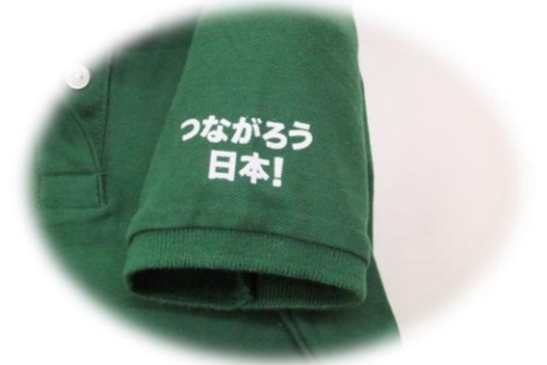
左袖には支援の思いを込めて...