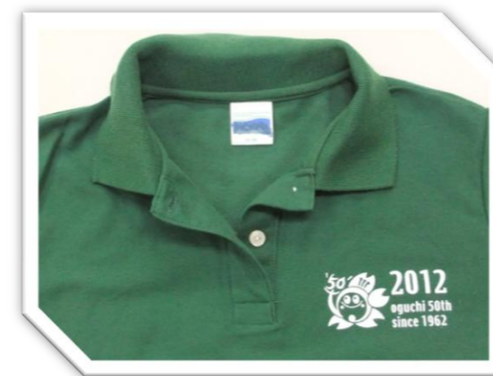
胸に町制50周年ロゴを入れました