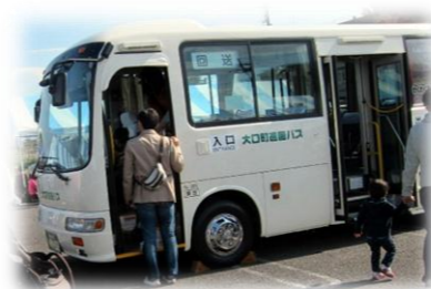
コミュニティバス試乗♪

11月3日(土)4日(日)に開催されたふれあいまつり2012に、今年9月から活動を始動し たコミュニティバスサポート隊(バスサポ隊)と町民活動まかせてネットがブース出展 しました。バスサポ隊は今年7月から応援ボランティアを公募、8月に結集しました。町民活動ま かせてネットでは、コミュニティバスをまちの資源、まちづくりのツールとし、バスサポ隊と一緒 に活動しています。バスサポの初出展となるふれあいまつりでは、くじ引きのアンケートを実施し、 皆様のご協力のおかげで、両日で約600件のアンケートを頂戴いたしました。このアンケート1枚 1枚を丁寧に集計し、コミュニティバスが皆さんに愛される公共交通になるよう、また「みんなが住み たいまちづくり」を目指し活動していきます!これからも、バスサポ隊の活動にご協力をお願いいたしま す。