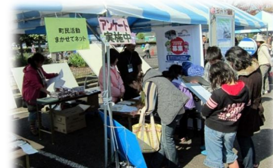
くじ引き付き! アンケート