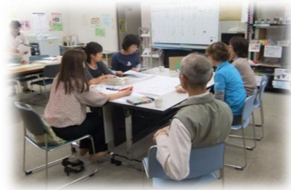
こんなこと話してます♪

活動センターの交流事業として、昨年度の10月から月に一度開催している“まちカフェ♪”。 ざっくばらんに話ができる「つながりづくり」の場、そしてそのつながりをもとにアイデアを発展させられる場にできるといいな、と考えています。