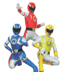
おおぐち元気戦隊 ダッシュマン