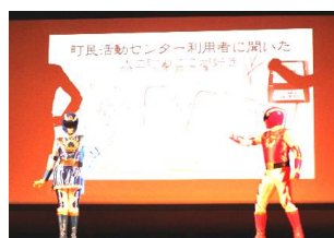
大口町のわがまち自慢