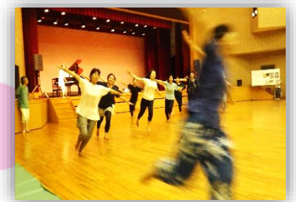
後半は保育関係者、保育士をめざす学生のためのリズム遊びを学ぶ会

子育てが楽しいものでありますように。どの子どもも幸せに育ちますように。子育て中のパパ・ママを応援します!