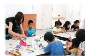
昭和のあそびパーク 実行委員会