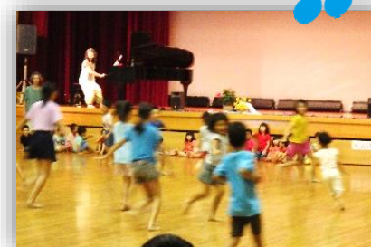
前半は親子でリズム遊び。ピアノに合わせて楽しく元気に体を動かそう!

子育てが楽しいものでありますように。どの子どもも幸せに育ちますように。子育て中のパパ・ママを応援します!